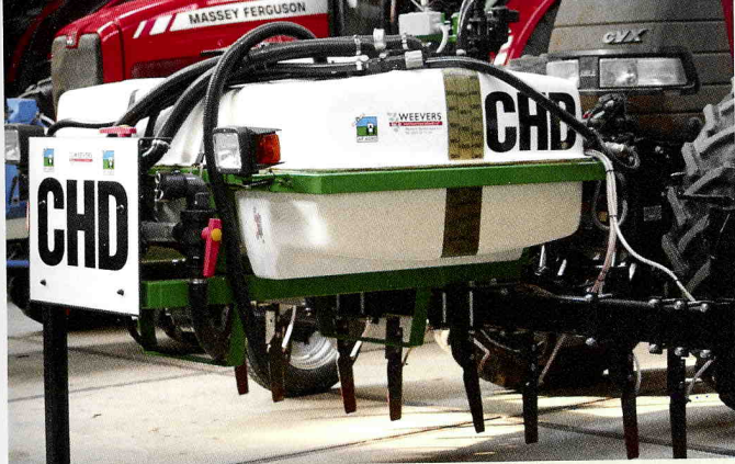
Mechanisatiebedrijf Weevers is de uitvinder van rijenbemesting met gps.