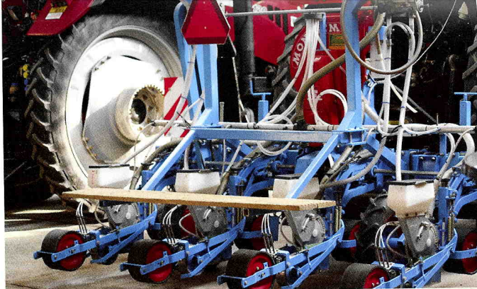
Op het zaad wordt door de machine van Loonbedrijf Corné Vinke Powerstart food toegediend.

van NCOR is ontwikkeld, wordt ook wel de slangenpompmachine genoemd. Het is een machine die eenvoudig en goedkoop is en als instapmodel fungeert. De meststof moet als water door de slangen blijven lopen en is toe te passen met kouters om de meststof te geven welke nodig is. In 2020 moet 50 % minder stikstof worden toegediend. Het beste is om stikstof en fosfaat tijdens het zaaien of planten mee te geven in de grond.