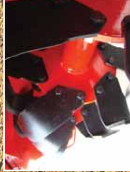
Eje rotor con azadas 01-TCL Rotor avec lames 01-TCL Rotor with 01-TCL blades