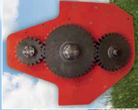
Transmisión lateral por engranajes Entraînement latéral par engrenages Gear-type transmission