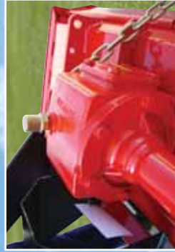
Caja de una velocidad Boîte monovitesse 1-speed gearbox